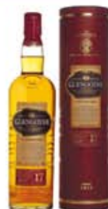
品名：格蘭哥尼17年 酒精度：43% CC數：700 ml 價格：1550 元