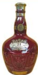
品名：皇家禮炮21年 酒精度：40% CC數：700 ml 價格：2900 元