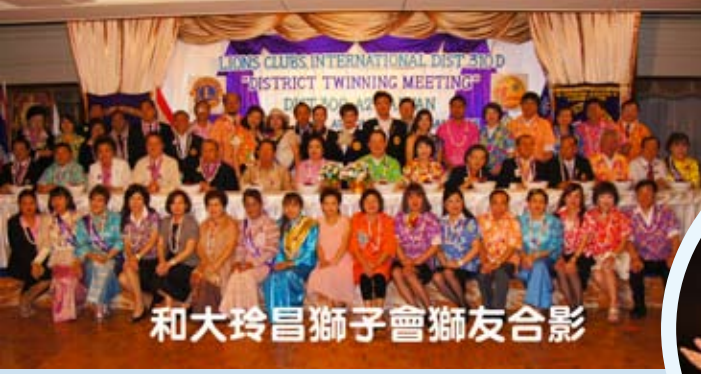
和大玲昌獅子會獅友合影