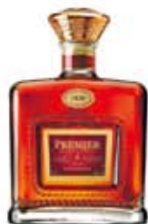
品名：約翰走路尊爵 酒精度：43% CC數：700 ml 價格：2500 元