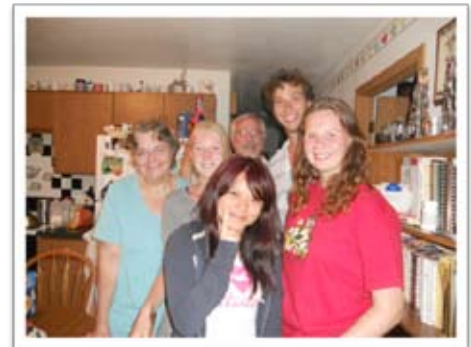
我與另一寄宿家庭合影