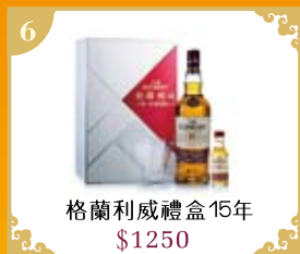
6 格蘭利威禮盒15年 $1250