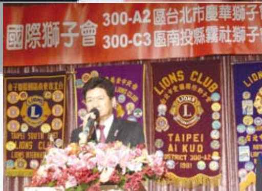
李總監致詞恭賀及祝福兩會結盟圓滿成功