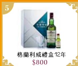
5 格蘭利威禮盒12年 $800