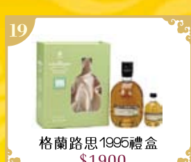
19 格蘭路思1995禮盒 $1900