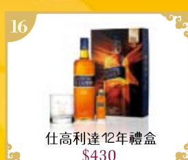
16 仕高利達12年禮盒 $430