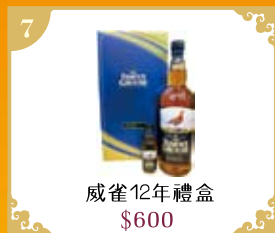
7 威雀12年禮盒 $600