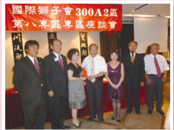
慈暉捐白米500斤給龜馬山真慶宮