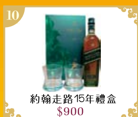
10 約翰走路15年禮盒 $900