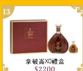
13 拿破崙XO禮盒 $2200