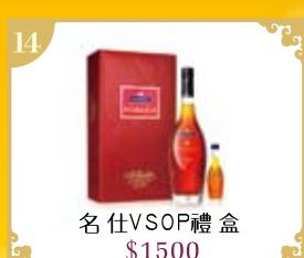
14 名仕VSOP禮盒 $1500