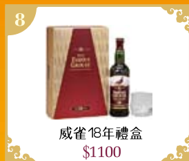
8 威雀18年禮盒 $1100