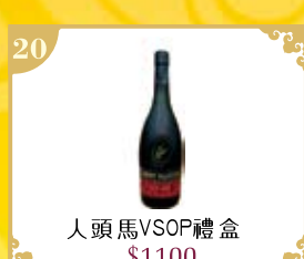
20 人頭馬VSOP禮盒 $1100