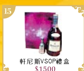
15 軒尼斯VSOP禮盒 $1500