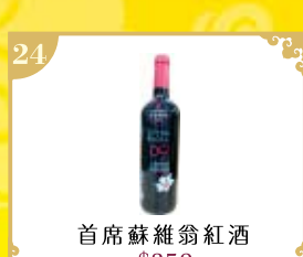
24 首席蘇維翁紅酒 $250