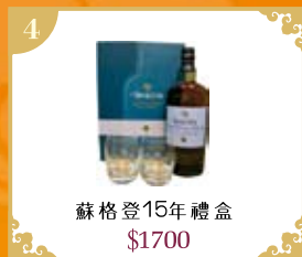
4 蘇格登15年禮盒 $1700