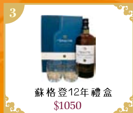
3 蘇格登12年禮盒 $1050