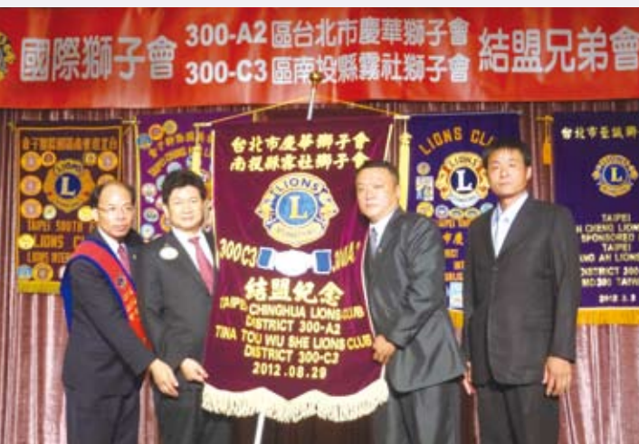
兩會互相交換結盟紀念旗

獅誼，擴展社會服務，造福人群以促進世界和平為目的，在他的見證下簽署兄弟結盟證書；正式結盟為兄弟會感到非常欣慰，並給予最誠摯的祝福與最大的祝賀之意，同時也希望透過這次的結盟，讓A2區與C3區兩區的互動更好更頻繁。