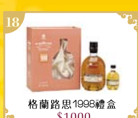
18 格蘭路思1998禮盒 $1000