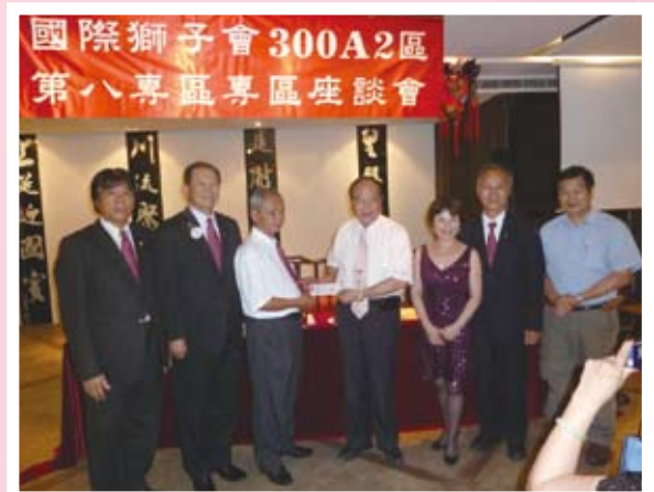
南門捐款龜馬山真慶宮13萬元