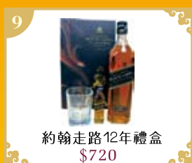
9 約翰走路12年禮盒 $720