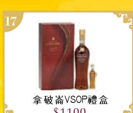
17 拿破崙VSOP禮盒 $1100