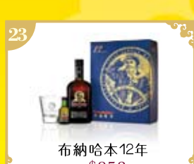
23 布納哈本12年 $950