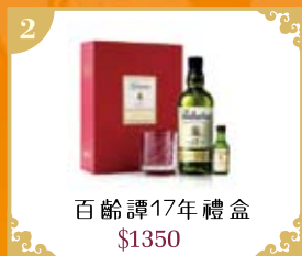
2 百齡譚17年禮盒 $1350