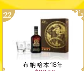
22 布納哈本18年 $2200