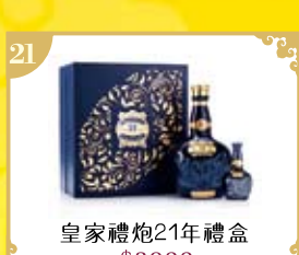
21 皇家禮炮21年禮盒 $2900