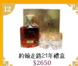
12 約翰走路21年禮盒 $2650