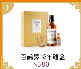
1 百齡譚12年禮盒 $680