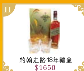
11 約翰走路18年禮盒 $1650