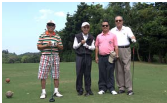
D區參賽第一組開球合影