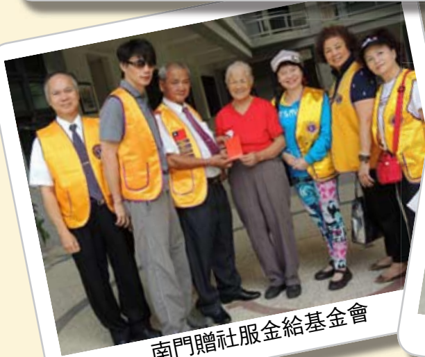
南門贈社服金給基金會