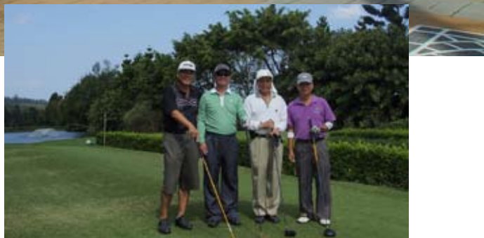
C區參賽第一組開球合影

9月25日，一個適合戶外活動的典型秋季氣候，藍天白雲、涼爽不燥；一早，莊主席及多位副主席便將獅子會旗沿林口交流道一路插到會場大門，加上在俱樂部會館大大的紅布條，讓活動更顯隆重、盛大。