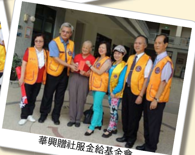
華興贈社服金給基金會

及各分會會長或獅友代表，以『主祭官』的身份列隊正殿前，隨後進入殿內，列隊呈香、花、果三獻禮。儀式結束後主祭官合影留念，本分區的祈福之行也告結束。