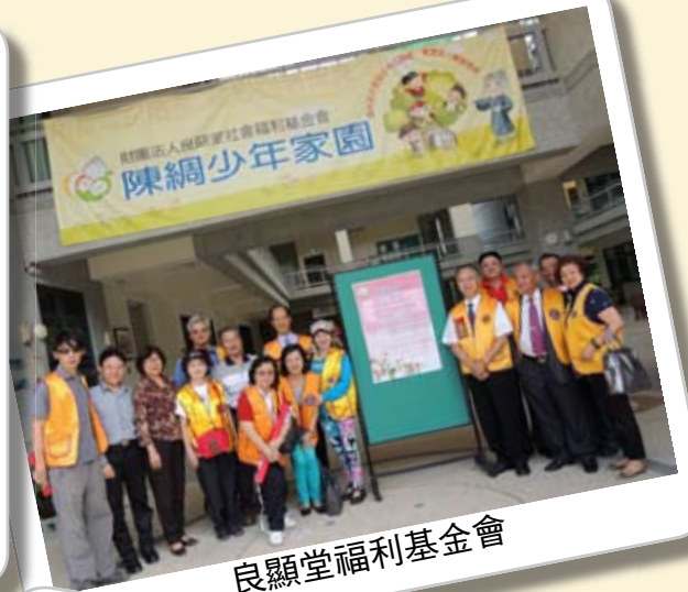
良顯堂福利基金會