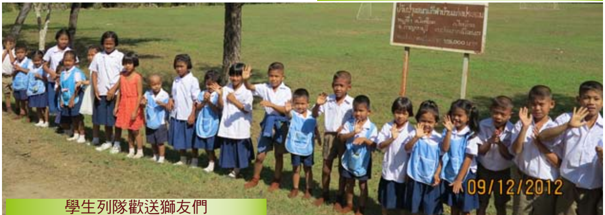
學生列隊歡送獅友們