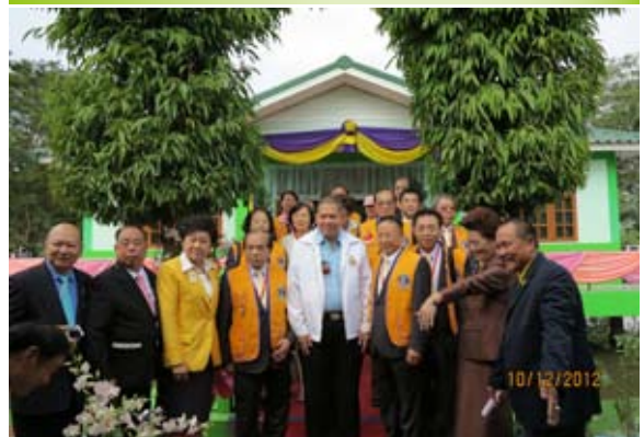
叻咪它亞圖書館前合影