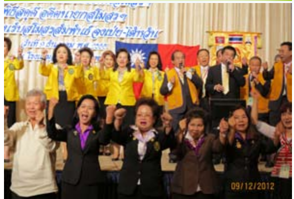
中北參加宗通擴大例會