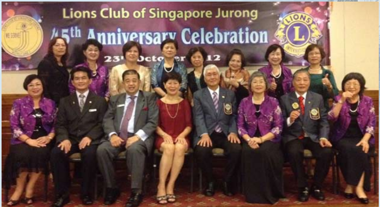
圖 / 文：會長 黃豐裕

台北市中區獅子會成立迄今已五十二個年頭，結盟的國外姊妹會多達十二會，每年均有姊妹會辦理大屆慶典，此國際交流活動，已然成為中區獅子會固定出訪的重要行程。今年適逢新加坡裕廊姊妹會授證四十五周年慶典，經過了二個月的策劃與聯繫，終於在十月廿二日啟程前往新加坡。